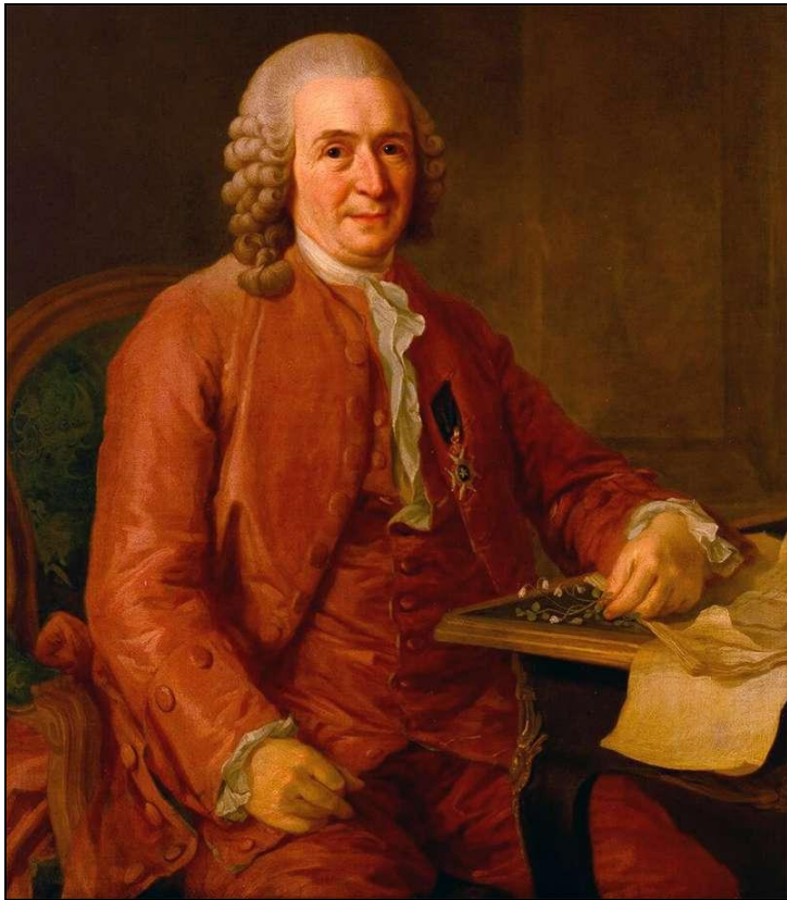
Карл Линней (1707 – 1778)

Дайте единственный правильный ответ на вопрос.